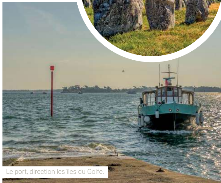
Le port, direction les îles du Golfe.