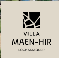
La VILLA MAEN-HIR, un emplacement idéal.