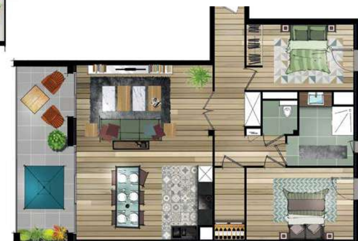
Exemple d'aménagement d'un T3 Esquisse non contractuelle

“ Confort du neuf et commodités à pied : rien ne manque. ”