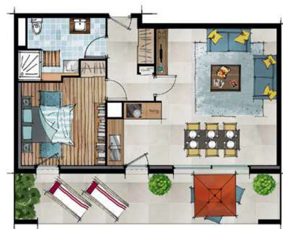
Exemple d'aménagement d'un T2 Esquisse non contractuelle

“ Un habitat respectueux des enjeux environnementaux. ”