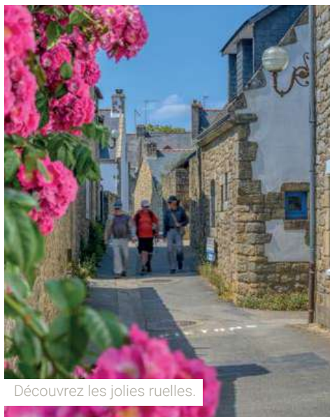
Découvrez les jolies ruelles.