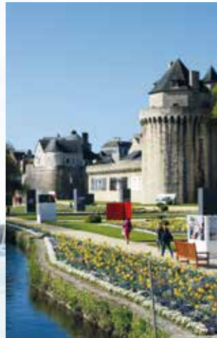
Les jardins des remparts