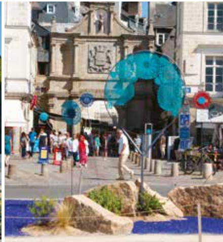
Exposition "Jardins ÉPHÉMÈRES"