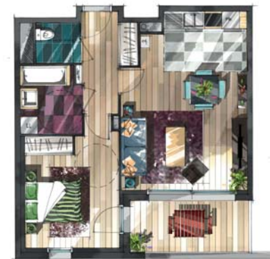
Exemple d'aménagement d'un T2

Les espaces intérieurs sont baignés de lumière grâce aux grandes ouvertures sur les terrasses, balcons et la nature environnante.