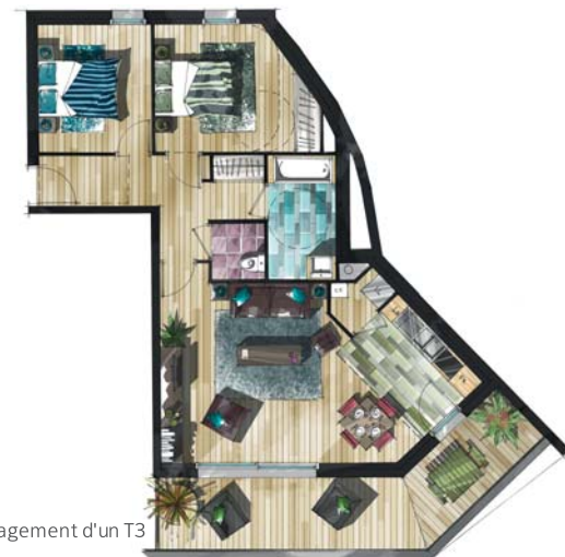
Exemple d'aménagement d'un T3