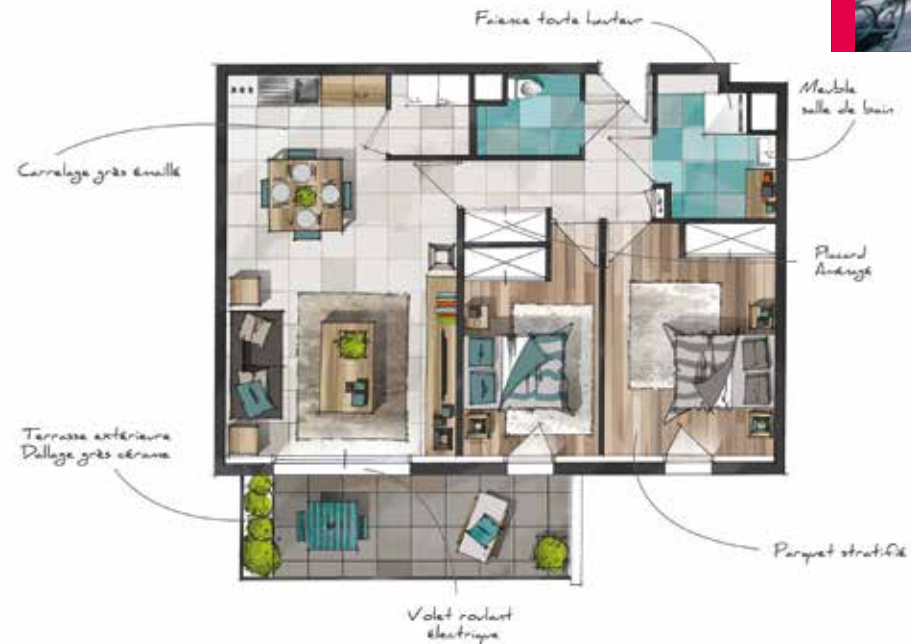
Exemple d'aménagement d'un T3 Niveau R+1