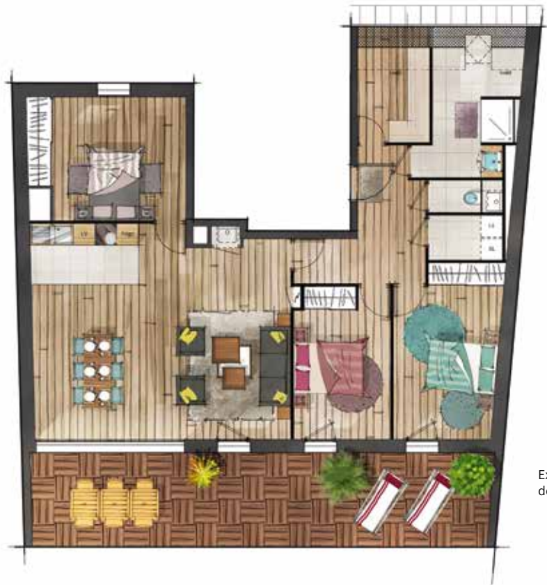
Exemple d'aménagement de l'appartement 41