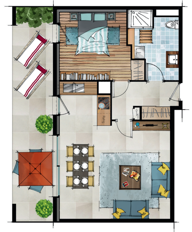
Exemple d'aménagement d'un appartement T2

Et si elle était la vôtre ? Rendez-vous à Arradon.