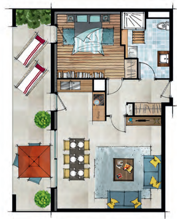
Exemple d'aménagement d'un appartement T2