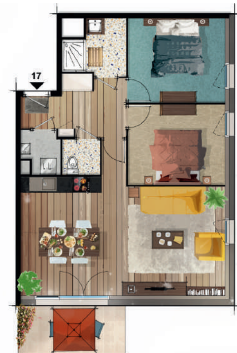
Exemple d'aménagement d'un appartement T3

Passionnante et pittoresque, la vie à Muzillac vous enveloppera de sa vitalité.